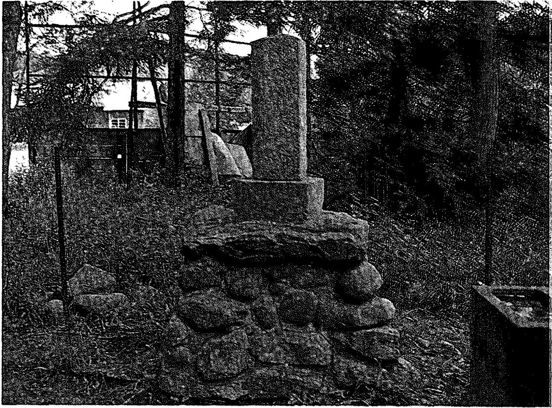
a 豊岡地神 余市町豊丘 豊丘神社境内