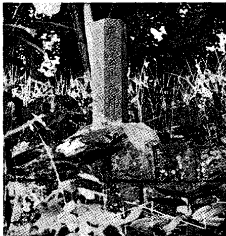
図5 有島神社、五神名六角柱型 地神塔 ニセコ町有島、彌照神社境内

また、徳島県の地神祠については、心柱は「五角柱が普通であるが高原地北のものは六角柱になっていて一面に年号を刻んである」(羊我山人、一七)の記載があるように、六角柱のものも一般には台石などに刻む紀年銘などをとくに背面など的一面を付加して刻銘したものと解釈され、五神名五角柱型の変形と考えてもさほど支障はなからう。