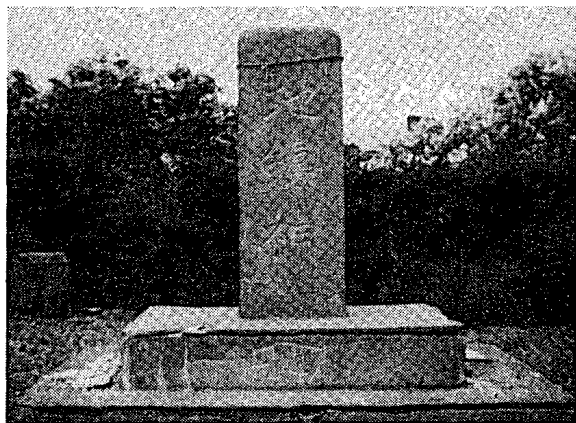
図1 「地鎮神」文字塔 苦小牧市勇弘、恵美須神社境内、 かつて同市静川にあったものとの こと(扇谷昌康氏による)。

このように地神は北海道ではほぼ部落共同の作神として奉斎されているようであり、そのように考えることに重大な支障があるとは現在では考えられないが、地神は「ぢちんさん」と呼ばれることがきわめて多く、また苦