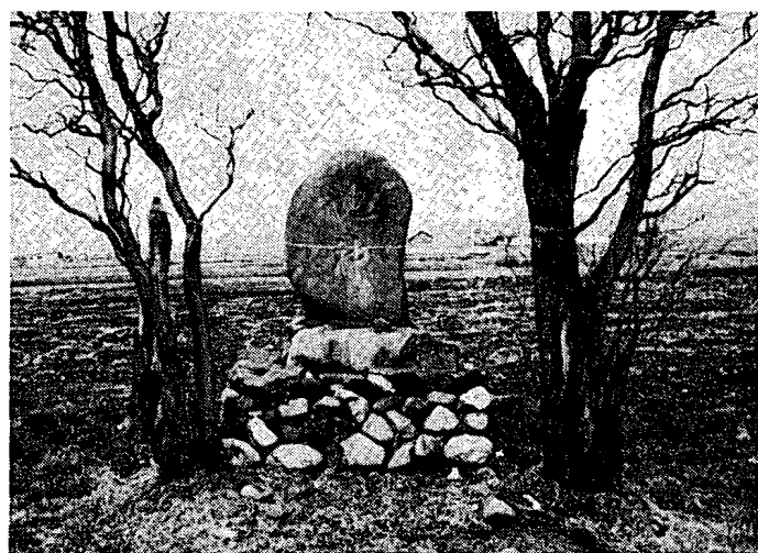
図7 北大沼地神 富良野市北大沼1

一 神籬には、通常このようにイチイ(アララギ、オンコ Tanus cuspidata Sieb. et Zucc.)などの常緑樹がもちいられることが多いようであるが、富良野市学田一区の自然石文字塔の両側にはウンリュウヤナギ ( Salix matsudana Koide. forma fortis Rehder) が植えられている。(図七)