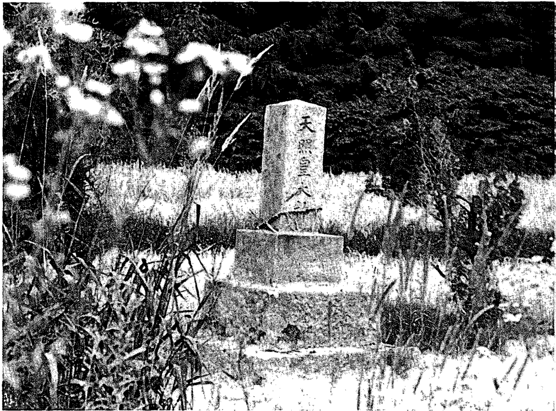
b 江幌2地神 上富良野町江幌2