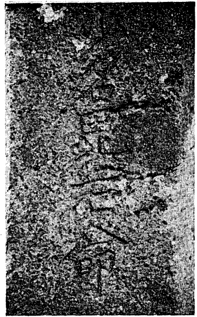
図4 豊丘地神第4面神号 余市町豊丘、豊丘神社 境内

四 香川県(加藤、二五―二六) 兵庫県淡路島(直江、二八八、和田、一五三)、岡山県(島村、二〇四)、神奈川県(付表、d)、本稿でも紹介した千葉県(服部、四七)、埼玉県(武田、二九九)