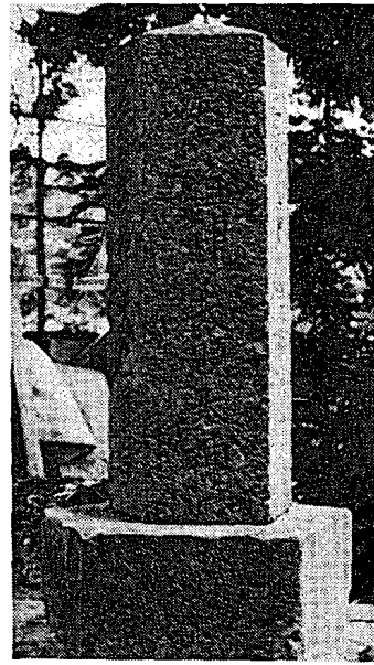
図3 豊丘地神第1面 豊丘神 余市町豊丘、豊丘神 社境内

さて、ここでとくにこの豊丘地神をとりあげたのは、塔身に刻まれた祭神に、それぞれの性格を示すものが冠せられているからである。