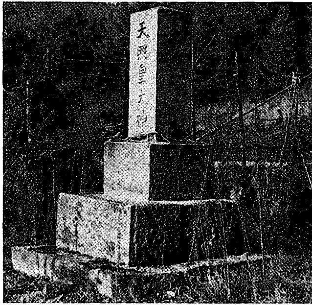
上富良野町江幌二

この塔の両側にはイチイが植えてあるが、上川地方には、このように塔の両側に神籬として樹を植栽するという要素が意識されているところがいくつもある。図六) 千葉県海上郡海上町の七部落の田ノ神についての報告がある。(服部、四七―四九)